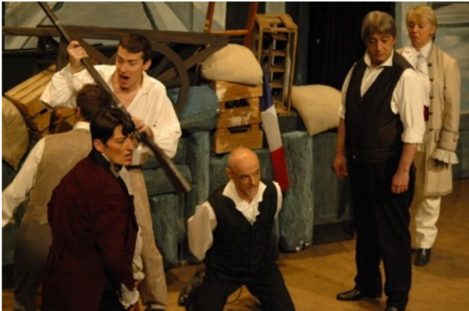
Une comédie musicale d'après "Les misérables" de Victor Hugo.

Les productions se succèdent : "L'atelier" de JC Grumberg, "13 à table", "Boom, ça c'est Paris", "70 années magiques" et "Les misérables";