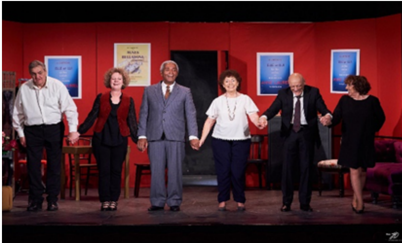
”Agnès Belladonne” de Jean-Paul Allègre