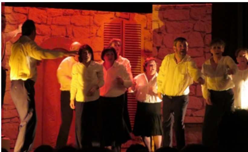
”Building” De Léonore Confino