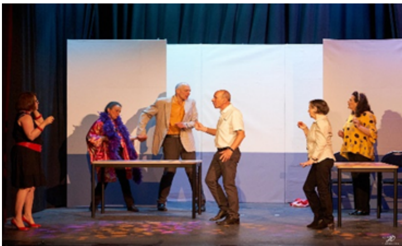
”Jeux de massacre” d’Eugène Ionesco